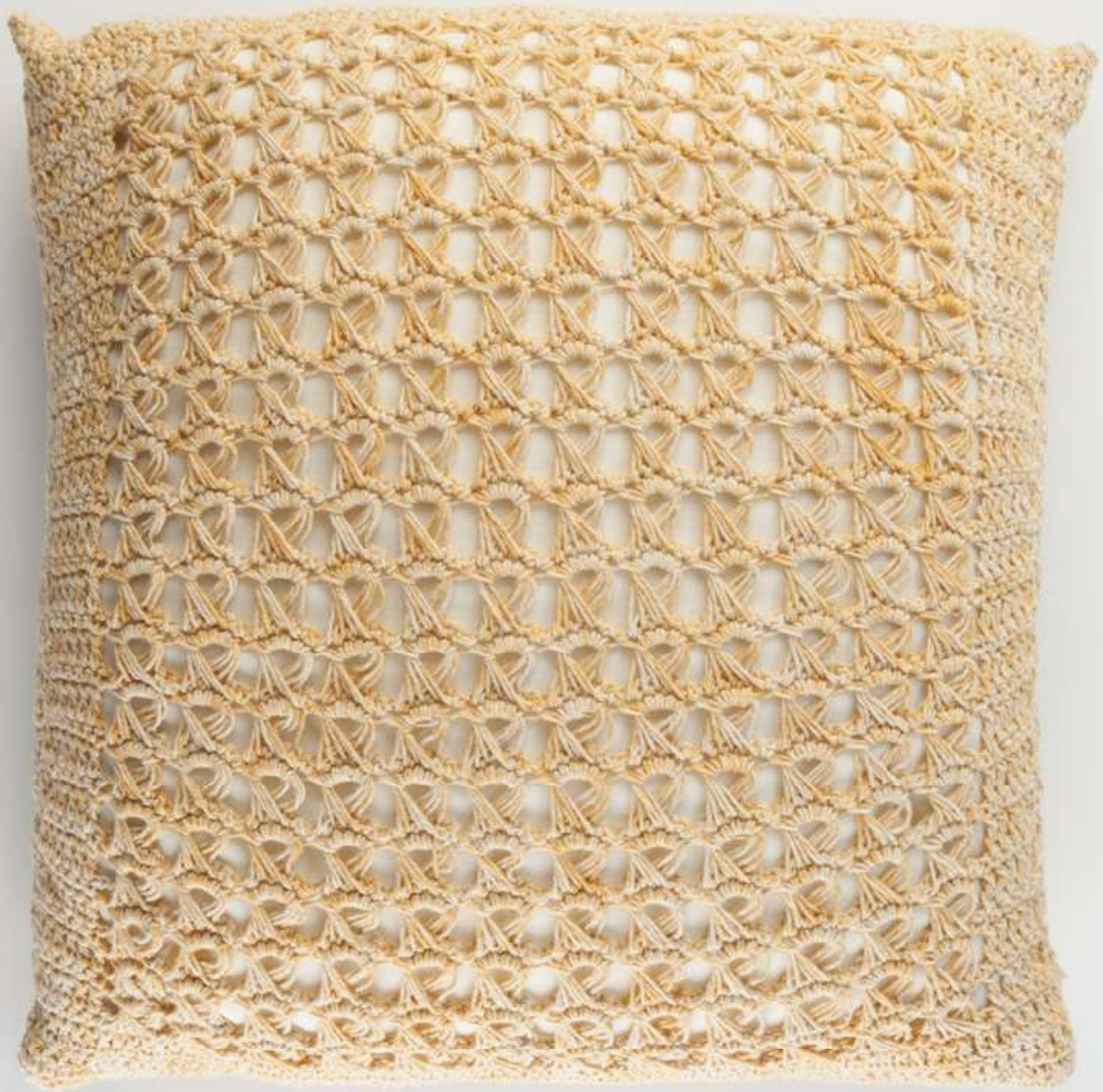
Almofada Damasco Amarela Yellow Damasco Cushion