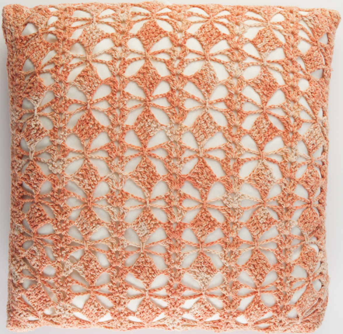
Almofada Damasco Laranja Orange Damasco Cushion