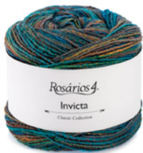
INVICTA Cor 25 (51% lã virgem, 49% acrílico)