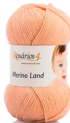
MERINO LAND Cor 35 (100% lâ merino)

Em ponto mousse (sempre em meia): tricotar em meia até ao momento de virar o trabalho, passar 1 malha como liga, sem tricotar, e trazer o fio para a frente. Voltar a colocar a malha passada na agulha da esquerda, virar o trabalho e tricotar em meia.