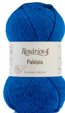
FALÉSIA Cor 29 (50% Algodão; 50% Bambu)