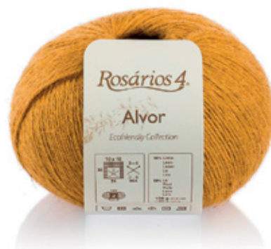
ALVOR Cor 13 (50% linho, 50% lã)