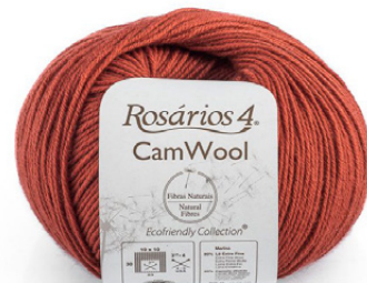
CAMWOOL Cor 15 (80% lâ extra fina; 20% camelo)