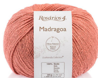
MADRAGOA Cor 23 (100% seda)