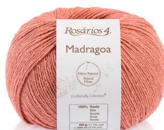
MADRAGOA Color 23 (100% seda)