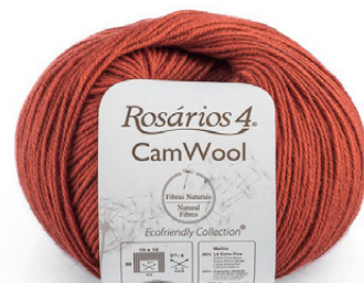
CAMWOOL Color 15 (80% lana extrafina; 20% camello (bebé))