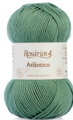
ATLÁNTICO Color 11 (80% Algodón Orgánico; 20% Liocel)