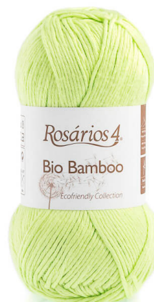
BIO BAMBOO Color 04 (100% Viscosa de Bambú)

En las vueltas siguientes los puntos dobles se tejen como puntos simples, tejiendo las 2 hebras juntas.