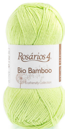
BIO BAMBOO Color 04 (100% Viscosa de Bambú)

En las vueltas siguientes los puntos dobles se tejen como puntos simples, tejiendo las 2 hebras juntas.