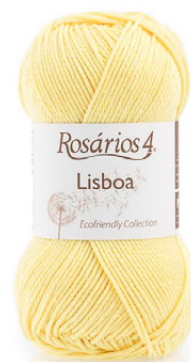
LISBOA Cor 28 (100% Algodão Mercerizado)