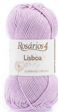
LISBOA Cor 25 (100% Algodão Mercerizado)